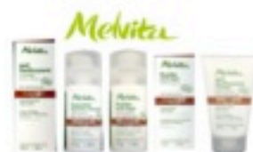
Prodotti Cosmetici Naturali e Bio