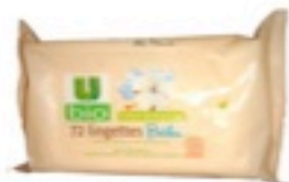
Salviette ipoallergeniche dermatologicamente testate